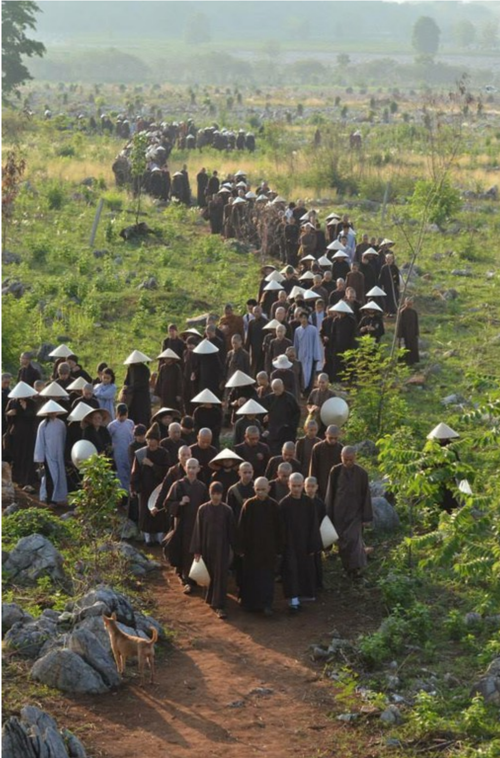
Thiền hành trên đất mới của Trung tâm Làng Mai quốc tế tại Thái Lan

- Rồi từ 23 đến 29 tháng Tư 2013 là Khóa tu Sư Ông giảng tiếng Việt cho hơn 1 ngàn cư sĩ Việt Nam. Đồng bào đi bằng phi cơ từ Hà Nội, đi xe buýt từ các tỉnh miền Trung và miền Nam, một số lớn đi từ TPHCM và các tỉnh đồng bằng sông Cửu Long. Dù xuất hành từ đâu, đến đất Thái bằng bất cứ phương tiện gì thì tất cả đều đến cùng một điểm hẹn tại Pak Chong để cùng nhau tu tập.