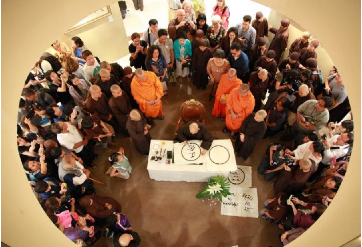
Sư Ông viết thư pháp trong giờ khai mạc triển lãm tại Trung Tâm Văn Hóa và Nghệ Thuật Bangkok.

- Sau đó từ 13 đến 17 tháng Tư là Khóa tu một tuần dành cho thanh thiếu niên và gia đình ở Nakhonratchasima. Đây là một khóa tu cho 1030 người tĩnh tu trong 2 khu nghỉ mát (resort) gần nhau. Buổi Pháp thoại sáng thì do Sư Ông giảng chung cho thiền sinh của cả 2 khu. Sau khóa giảng thì ai ở khu nào về khu đó sinh hoạt riêng cho 2 thời còn lại là trưa và tối. Một bên có được 20 Giáo thọ trung niên dạy cho 580 bậc mẹ cha ở resort Wang Ree. Một bên là khóa tu cho người trẻ trong phong trào Wake Up do 18 vị Giáo thọ trẻ dạy 450 sinh viên học sinh từ nhiều nước tới tu chung ở một resort kề bên. Trong số 450 người trẻ này gồm có non 300 người Thái cùng với 150 sinh viên từ Indo và 7 nước láng giềng trong đó có 15 em sinh viên đến từ Việt Nam. Xong khóa tu ai cũng bịn rịn không muốn về. Bậc làm cha mẹ bỗng nhận ra con mình quá dễ thương, biết lắng nghe hơn trước, phận làm con thì thấy cha mẹ sao quá ngọt ngào. Thị giả Sư Ông báo cáo là lần này Sư Ông ngồi trên lầu bên trên nhìn xuống và bảo là Người rất hạnh phúc thấy các con xuất sĩ của Thầy tổ chức rất khéo, dạy cũng giỏi, làm việc tinh chuyên và nhất là có tinh thần huynh đệ thương kính nhau chăm sóc cho nhau, có tình anh em, có tình chị em rất vui trẻ tíu tít bên nhau !