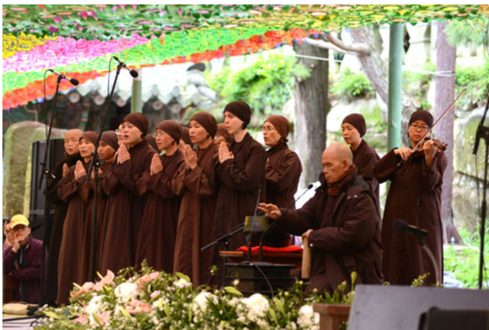
Sư Ông chú nguyện, Tăng đoàn niệm bồ tát Quán Thế Âm trước giờ pháp thoại tại Busan.

kín Sư Ông và báo tin là: "Chúng con không ngờ thiên hạ quy ngưỡng Sư Ông và đến đông như thế. Chúng con xin Sư Ông vui lòng báo tin dùm là ngày 27 tháng Chín sắp tới Giáo Hội chúng con sẽ tổ chức Lễ Cầu Nguyện Hòa Bình cho toàn quốc Nam - Bắc Hàn xin Sư Ông mời dùm mọi người nhớ đến đông đủ như hôm nay hoặc nhiều hơn". Sư Ông bỗng lên tiếng sửa lại: "Cầu Nguyện thôi thì không đủ. Quý vị phải tu trước một tháng... phải mời những nhân sĩ, những người có lòng với quốc gia dân tộc đến tu tập thiền quán để đạt tới tuệ giác phải làm sao chấm dứt tranh chấp giữa anh em riêng Nam Hàn trước. Công giáo, Phật giáo đều thực tập hiểu và thấy giá trị của nhau. Đảng cầm quyền và đảng đối lập cũng phải tập chấp nhận giá trị của nhau. Miền Nam ổn định và sẽ liên hệ với Miền Bắc từng bước một..."