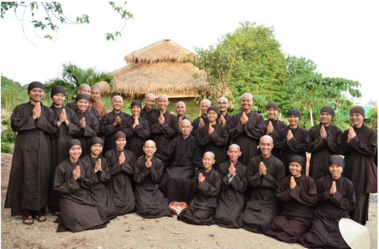
Sư Ông và 26 tân xuất sĩ gia đình cây Hoa Gạo.

Ngoài ra còn có cha, mẹ của các thầy và sư cô sang Thái thăm con và tu học, nên nếu kể luôn xuất sĩ và cư sĩ là 1450 người. Năm resorts gần nhau chứa hơn 1 ngàn thiền sinh. Số khác ngủ lại trong thiền đường nhỏ giữa các cư xá của quý sư cô và quý thầy tại Trung tâm Làng Mai Quốc Tế ở Thái. Trong tuần này ban tổ chức lại xin làm lễ Khai Pháp chính thức cho Trung Tâm vào ngày 28 tháng Tư 2013. Sớm hôm đó vào lúc 5:30 giờ sáng Sư Ông đã làm Lễ Xuất Gia cho 26 đứa con tập sự của Sư Ông để trở thành 12 sư chú và 14 sư cô thật xinh xắn trong gia đình 26 Cây Hoa Gạo (Kapotiers). Tiếp theo là Lễ Truyền Đăng cho 20 vị Tân Giáo thọ thuộc gia đình Cây Hương Dương xuất gia đọt đầu tại Tu Viện Bát Nhã - Lâm Đồng.